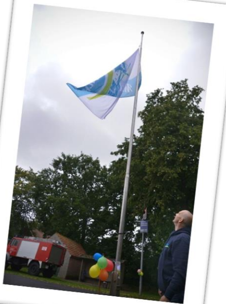
... und am Ende fliegt sie doch, die neue Dorf-Flagge!