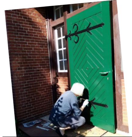
Die fleißigen Hände ...

„De een maakt dit, de anner dat, tosamen sünd wir stark. So word dat immer mojer bi uns in Mitling-Mark.“