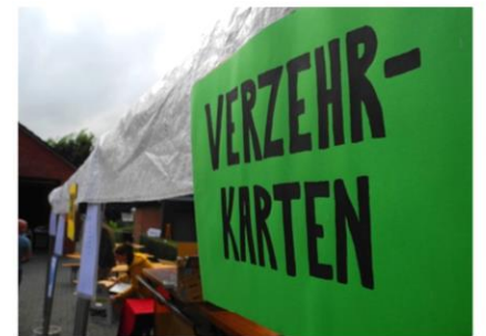
Super Idee: Bargeldloses Zahlen!