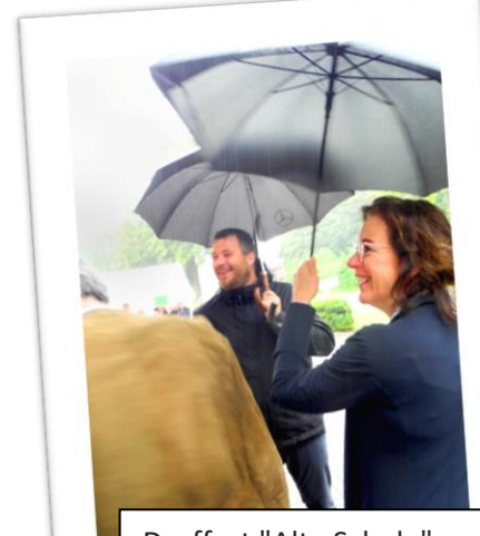
Dorffest "Alte Schule": Regen! Na und?.....

Unser Dörpsbladd erscheint etwa 3-4 x im Jahr und gibt vor allem allen digital nicht so Aktiven noch einmal einen kurzen Rückblick auf die wichtigsten Aktivitäten des Dorfvereins aus den letzten Monaten. Es liegt aus im Dorfbriefkasten und wird von einigen Kindern im Dorf auch persönlich verteilt – vor allem für unsere älteren Nachbarn. Sehr viel mehr Infos und Bilder sowie auch alle Sitzungsprotokolle gibt's über den Login-Bereich der Homepage und in der Vereins-Cloud – exklusiv für Mitglieder.