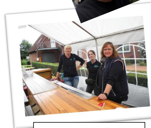
... und die Belohnung danach: Tolles Team hinter'm Tresen!